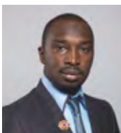
Conseiller municipal délégué à l'Enfance

«Les colonies de vacances, ce sont avant tout, génération après génération, des histoires de vie communes, des légendes urbaines que l'on aime encore raconter et partager, tout au long de notre vie, avec la famille, les amis. Ce sont La Vignerie sur l'Île d'Oléron, le château du Parc à Yzeure dans l'Allier, des lieux de socialisation qui ont permis à beaucoup de jeunes de se réaliser en tant qu'adulte. Ce sont des images, des bruits, des odeurs... l'idée de goûter, pendant quelques semaines à une certaine idée du bonheur collectif. L'accès aux vacances est devenu un indicateur social, un signe d'intégration dans la société. Les vacances fonctionnent de nos jours comme une norme, c'est pour cela que plus de 600 enfants de 4 à 17 ans sont concernés chaque année par les séjours organisés par la Ville. Nous souhaitons permettre à un maximum de familles de bénéficier de ce droit aux vacances. Ne pas partir c'est être exclu de la société. Un enfant qui ne part pas en vacances est privé de l'essentiel, le droit de découvrir autre chose que le pied de son immeuble. Malgré nos difficultés financières, nous continuons, grâce à l'application du quotient familial, d'établir une certaine égalité entre les familles en organisant ces séjours. Et, pour ceux, encore trop nombreux, qui ne partent pas, nous maintenons Bajo Plage, dont le succès ne se dément pas!»