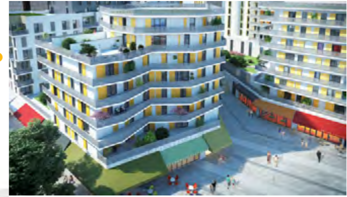
Vue sur le nouveau mail Gambetta depuis l'entrée de l'Hôtel de ville.

Le projet prévoit près de 4800m 2 de locaux commerciaux