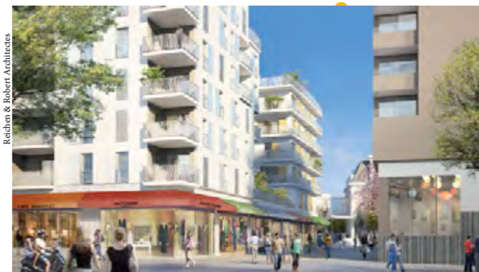
Vue sur l'aménagement du mail Bel'Est, prolongé pour mieux lier le centre-ville à Gallieni.