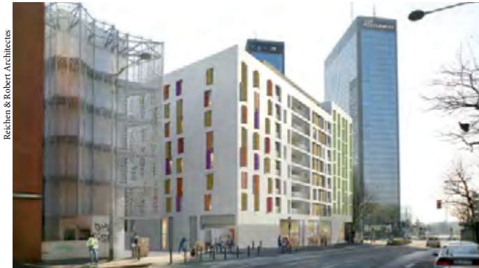
Vue sur la résidence étudiante depuis l'avenue Gambetta.

L'aménagement de la Zac Benoît-Hure va enfin lier le centre-ville historique et le centre économique Gallieni. C'est toute l'image de Bagnolet qui sera revitalisée et valorisée grâce à l'aboutissement de ce projet.