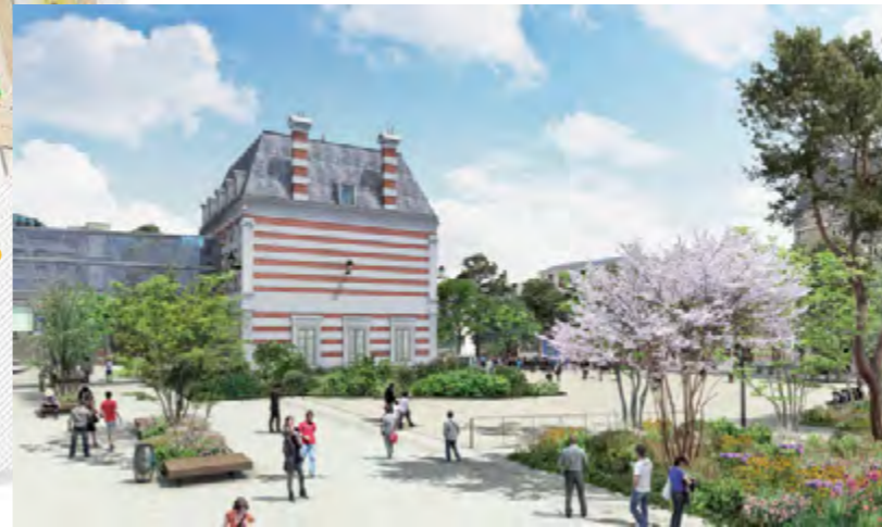
Vue de la place en arrivant du nouveau mail Bel'Est. L'ensemble des espaces publics seront complètement réaménagés (place Salvador-Allende et rues adjacentes) et seront accessibles aux personnes à mobilité réduite.

Les illustrations ne sont pas contractuelles.