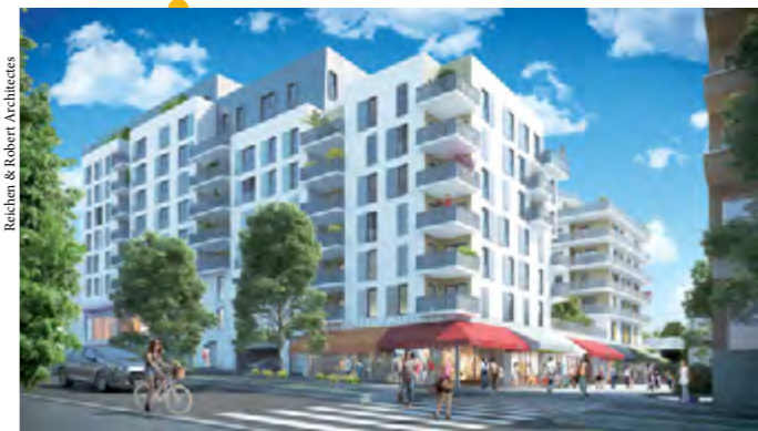
Vue sur les logements de la rue Adélaïde-Lahaye.