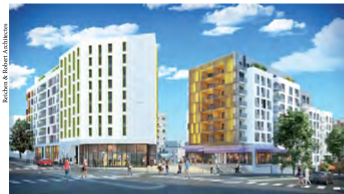
Vue sur l'hôtel et les logements en accession depuis l'angle Gambetta/Adélaïde-Lahaye.