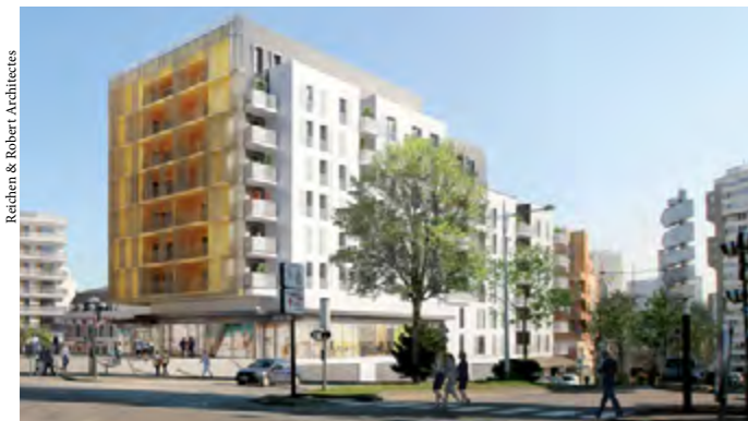
Vue sur la rue Adélaïde-Lahaye.