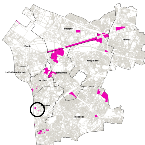
Carte de localisation